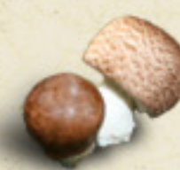
SUN AGARIC Agaricus blazei