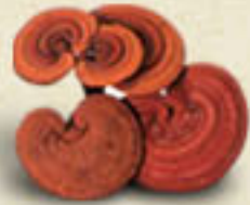
REISHI Ganoderma lucidum