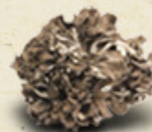
MAITAKE Grifola frondosa