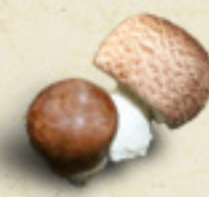
SUN AGARIC Agaricus blazeii