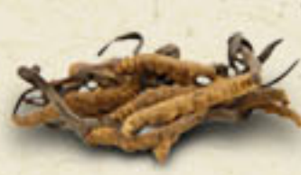
CORDYCEPS Cordyceps sinensis