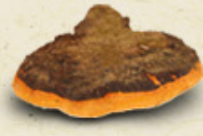
CHAGA Inonotus obliquus