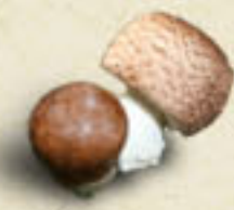
SUN AGARIC Agaricus blazei