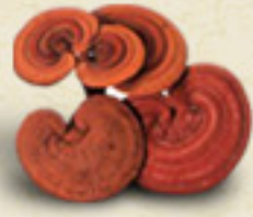
REISHI Ganoderma lucidum