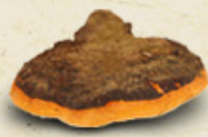
CHAGA Inonotus obliquus