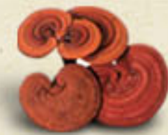
REISHI Ganoderma lucidum