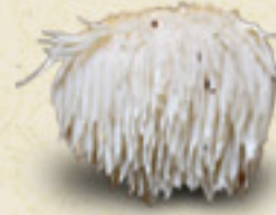
LION'S MANE Hericium erinaceus