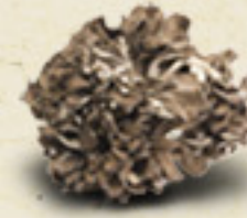
MAITAKE Grifola frondosa