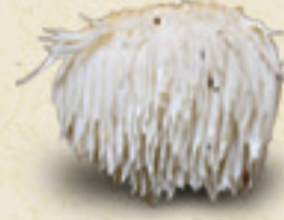
LION'S MANE Hericium erinaceus