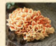
LOREM IPSUM DOLOR Lorem Ipsum Dolor