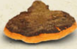
CHAGA Inonotus obliquus