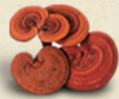
REISHI Ganoderma lucidum