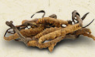
CORDYCEPS Cordyceps sinensis