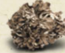
MAITAKE Grifola frondosa