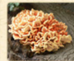
LOREM IPSUM DOLOR Lorem Ipsum Dolor