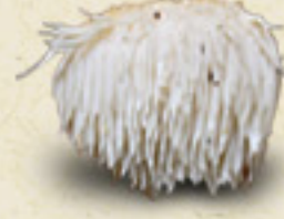
LION'S MANE Hericium erinaceus