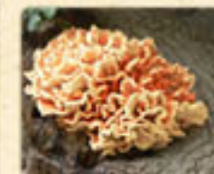
LOREM IPSUM DOLOR Lorem Ipsum Dolor