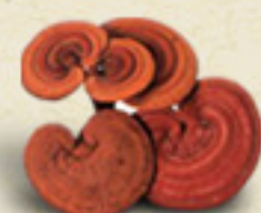
REISHI Ganoderma lucidum