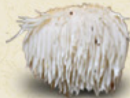
LION'S MANE Hericium erinaceus