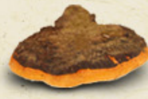
CHAGA Inonotus obliquus