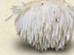
LION'S MANE Hericium erinaceus