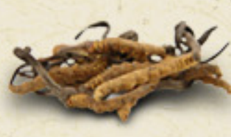
CORDYCEPS Cordyceps sinensis