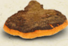
CHAGA Inonotus obliquus