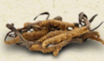
CORDYCEPS Cordyceps sinensis