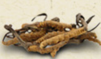
CORDYCEPS Cordyceps sinensis