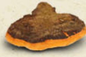
CHAGA Inonotus obliquus