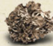
MAITAKE Grifola frondosa