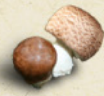
SUN AGARIC Agaricus blazeii