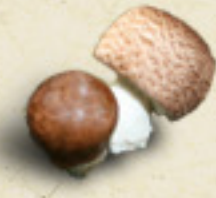
SUN AGARIC Agaricus blazei