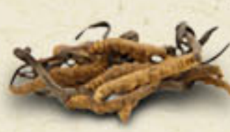
CORDYCEPS Cordyceps sinensis