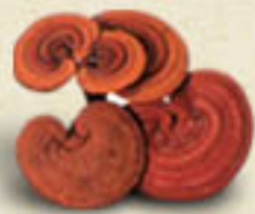
REISHI Ganoderma lucidum